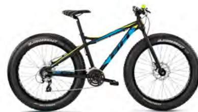
FAT BIKE / BH BIKES